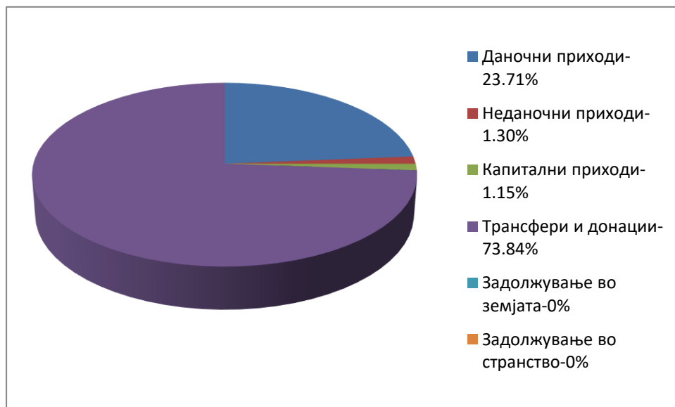
Графички приказ бр.2 - Клучни приходи на општината согласно економската класификација

Највисок процент на реализација е забележан кај Трансфери и донации, со реализација од 73,84 % во однос на вкупно планираните приходи, додека најнизок процент на реализација е забележан кај Капитални приходи, со реализација од 1,15 % во однос на вкупно планираните приходи. (Графички приказ бр.2)